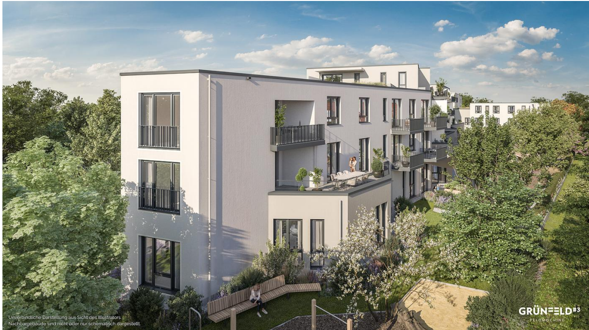
Unverbindliche Darstellung aus Sicht des Illustrators. Nachbargebäude sind nicht oder nur schematisch dargestellt.