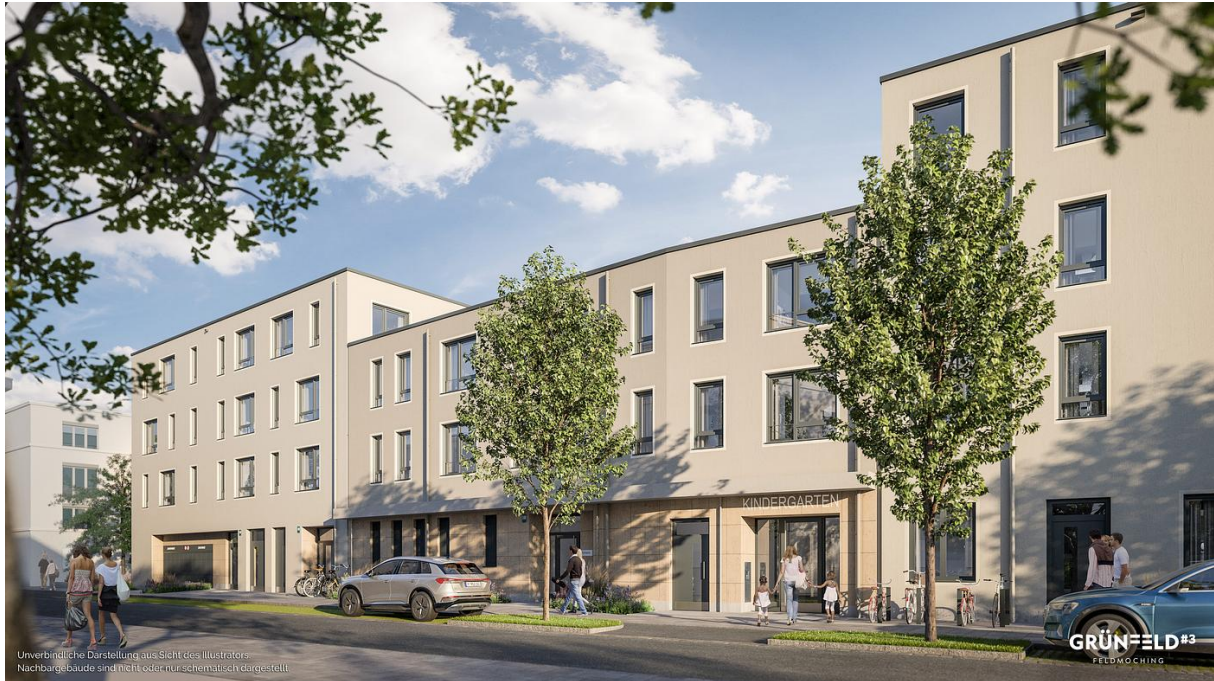
Unverbindliche Darstellung aus Sicht des Illustrators. Nachbargebäude sind nicht oder nur schematisch dargestellt.