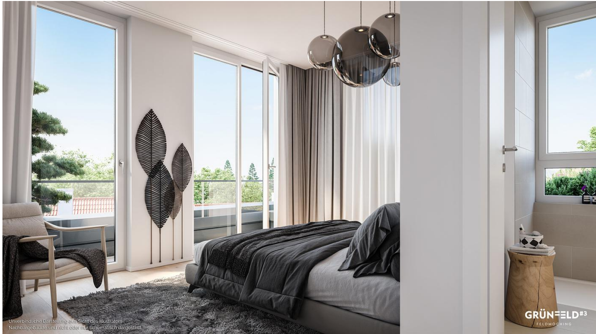
Unverbindliche Darstellung zum Sicht des Illustrators. Nachbargebäude sind nicht oder nur schematisch dargestellt.