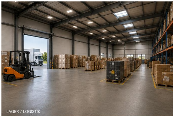
LAGER / LOGISTIK