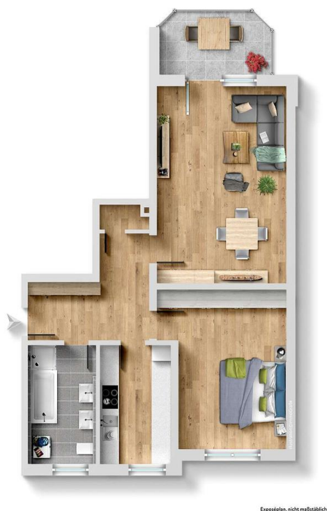
Exposplan, nicht maßstäblich