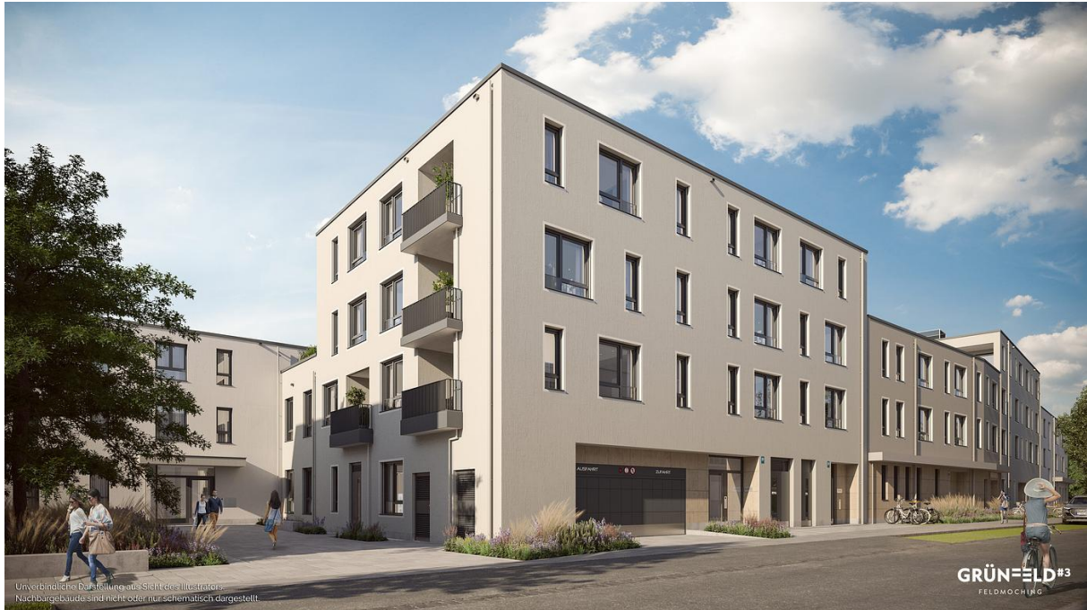
Unverbindlich dargestellte Ansicht des Illustrators. Nachbargebäude sind nicht oder nur schematisch dargestellt.