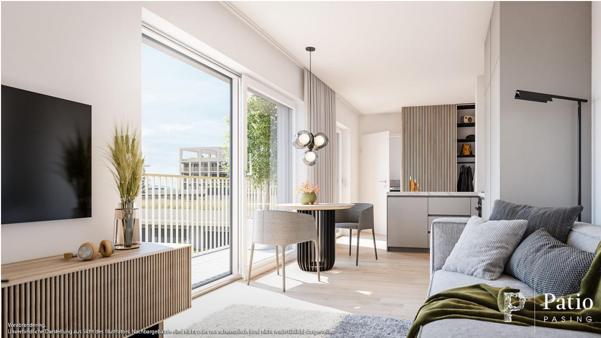
Veränderung: Unverbindliche Darstellung aus Sicht des Illustrators. Nachbargebäude sind nicht exakt (nur schematisch (und nicht maßstäblich) dargestellt.

WOHNUNG 12.1.4 Haus 12 | 1. OG | 1 Zi. | 43,76 m² Wfl. | 50,29 m² Nfl. baugleich / ähnliche: Wbg. 12.2.4 | Haus 12 | 2. OG | 1 Zi. | 43,76 m² Wfl. | 50,29 m² Nfl. Wbg. 12.3.4 | Haus 12 | 3. OG | 1 Zi. | 43,76 m² Wfl. | 50,29 m² Nfl.