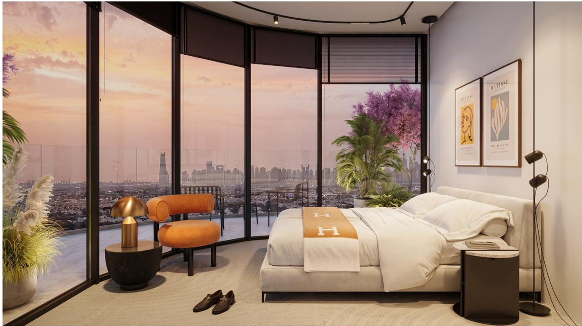
INTERSTELLAR TOWER ∞ Mr. Eight Development