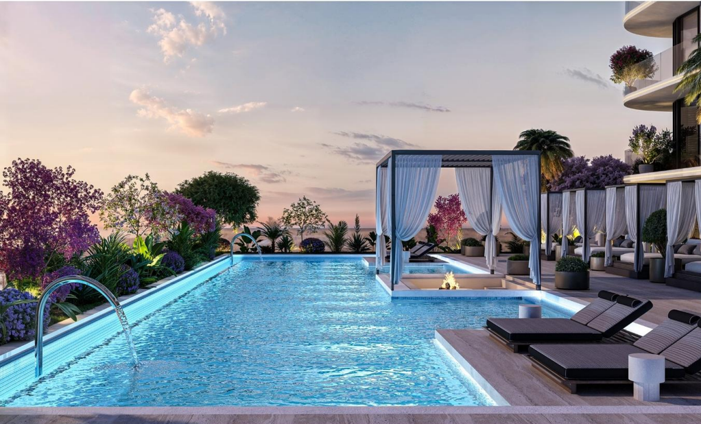
INTERSTELLAR TOWER 00MrEight