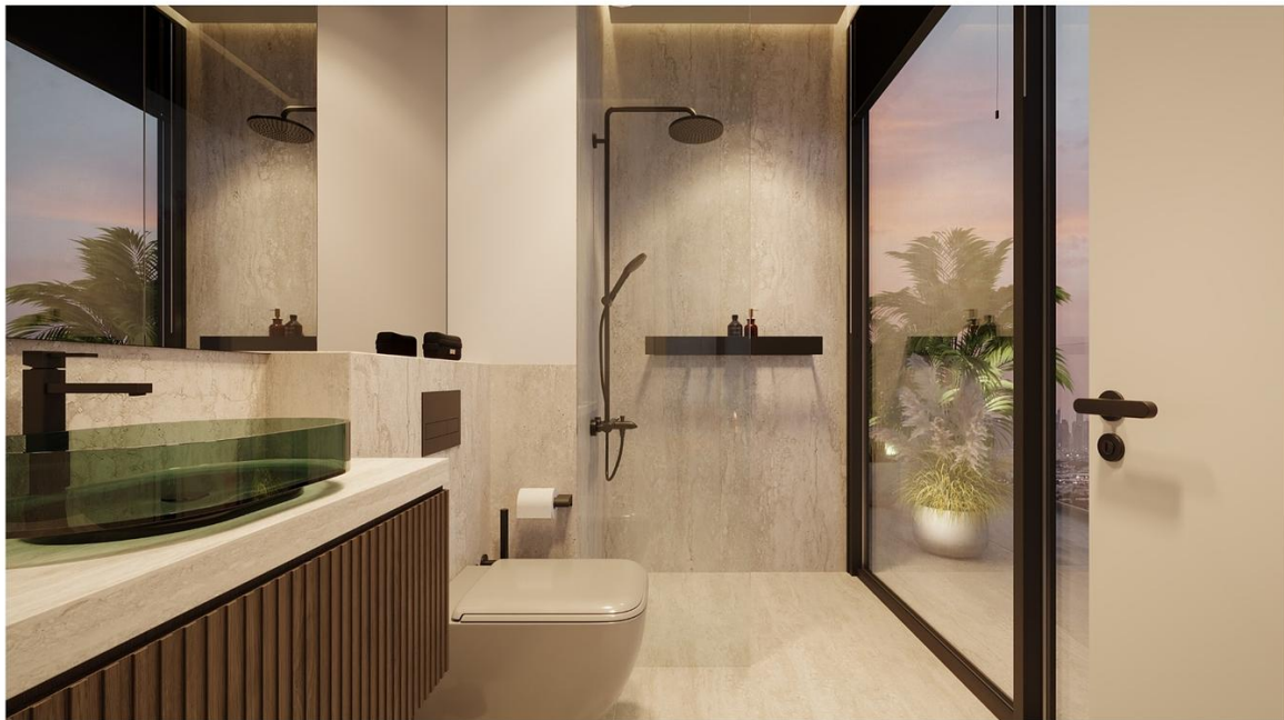
INTERSTELLAR TOWER Mr. Eight