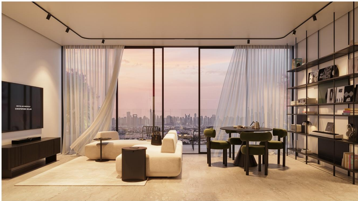
INTERSTELLAR TOWER ∞ Mr. Eight Development