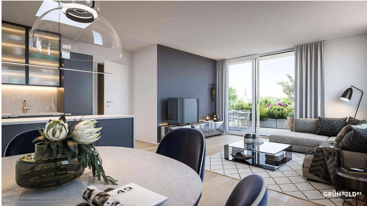
Unverbindliche Darstellung aus Sicht des Illustrators. Nachbargebäude sind nicht oder nur schematisch dargestellt.