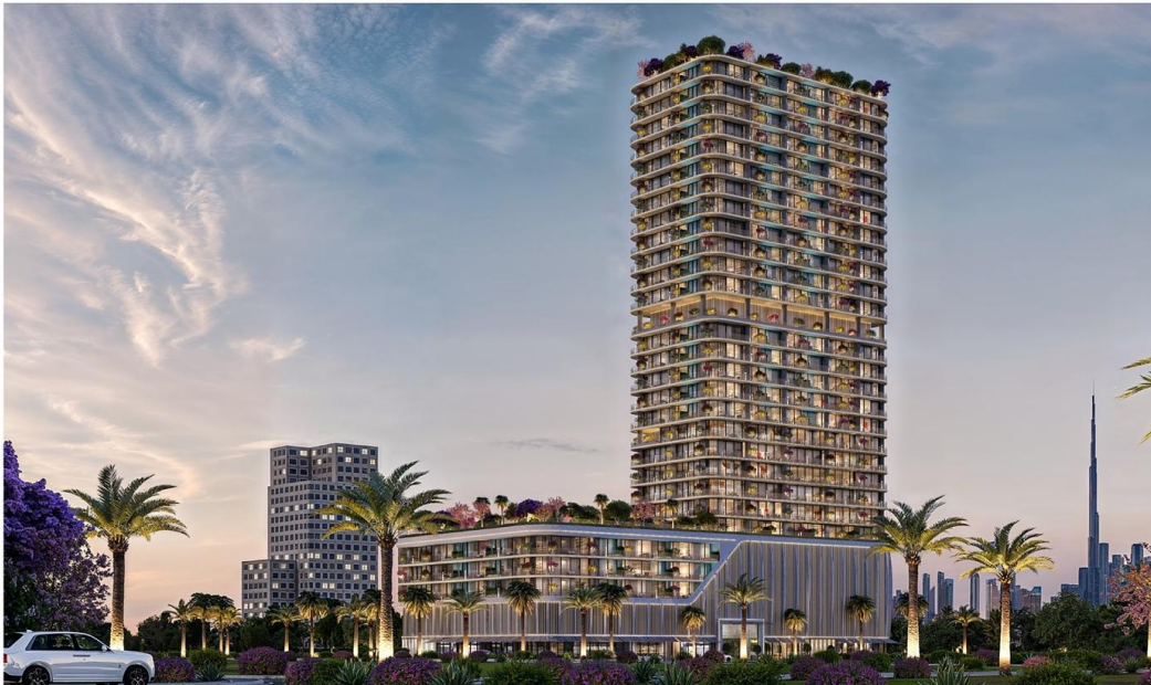
INTERSTELLAR TOWER by M+ Eight