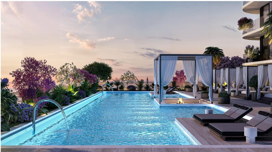
INTERSTELLAR TOWER ∞ Mr. Eight Development