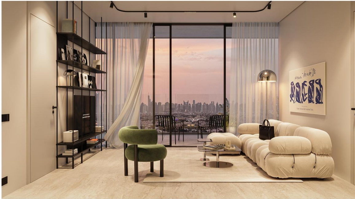
INTERSTELLAR TOWER Mr. Eight