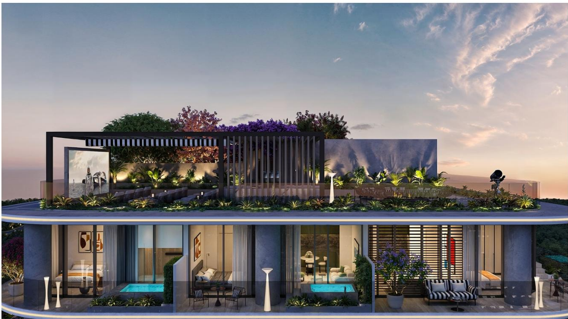
INTERSTELLAR TOWER ∞ Mr. Eight Development