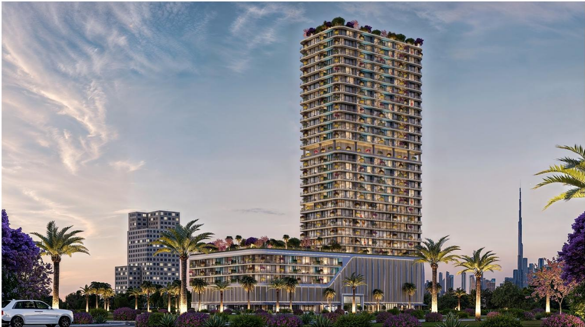
INTERSTELLAR TOWER ∞ Mr. Eight Development