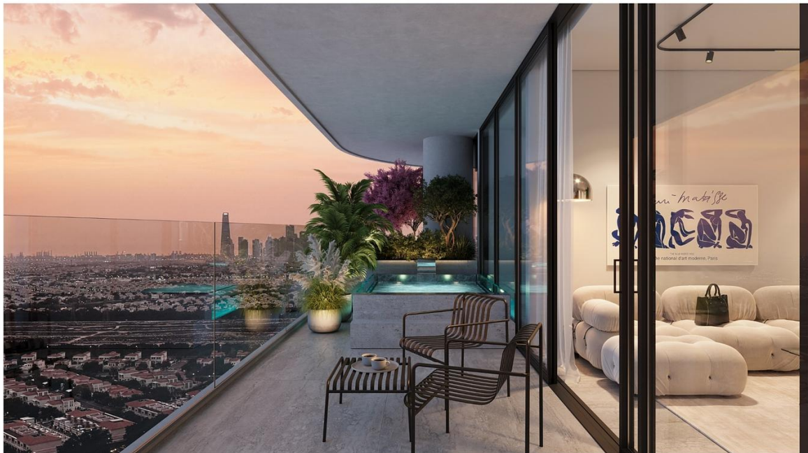
INTERSTELLAR TOWER Mr. Eight