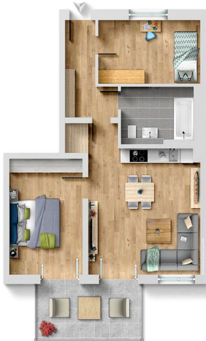
Exposplan, nicht maßstäblich