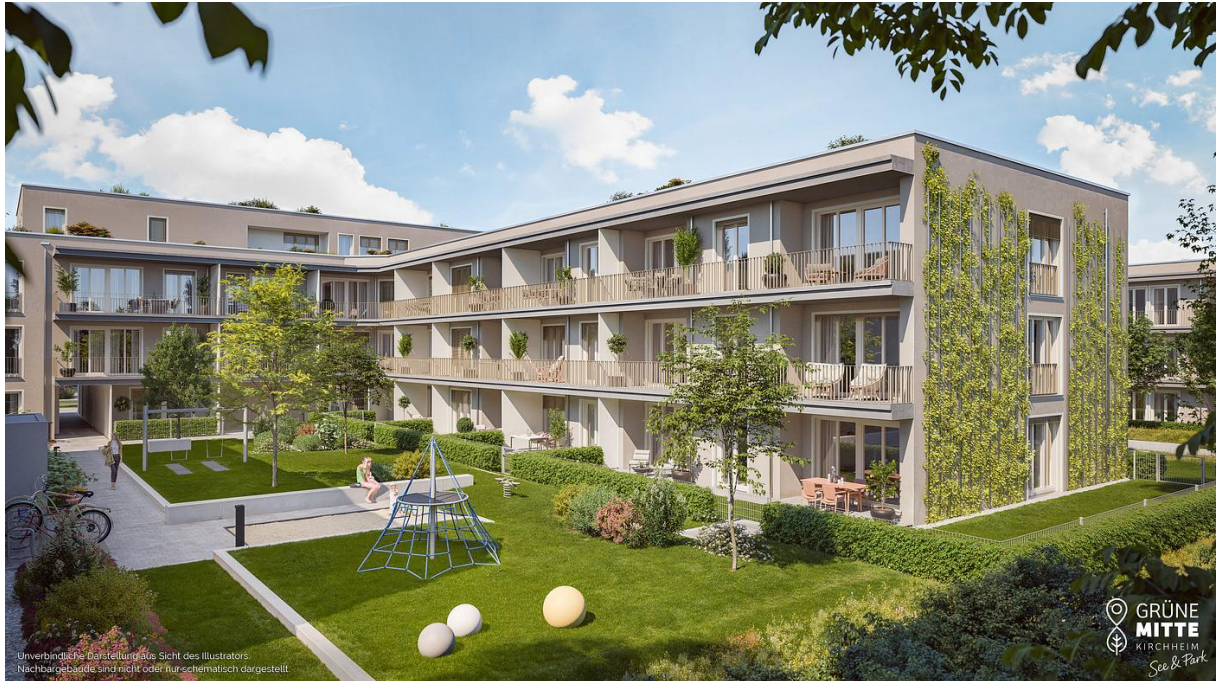
Unverbindliche Darstellungsverhältnisse. Sicht des Illustrators. Nachbargebäude sind nicht oder nur schematisch dargestellt.