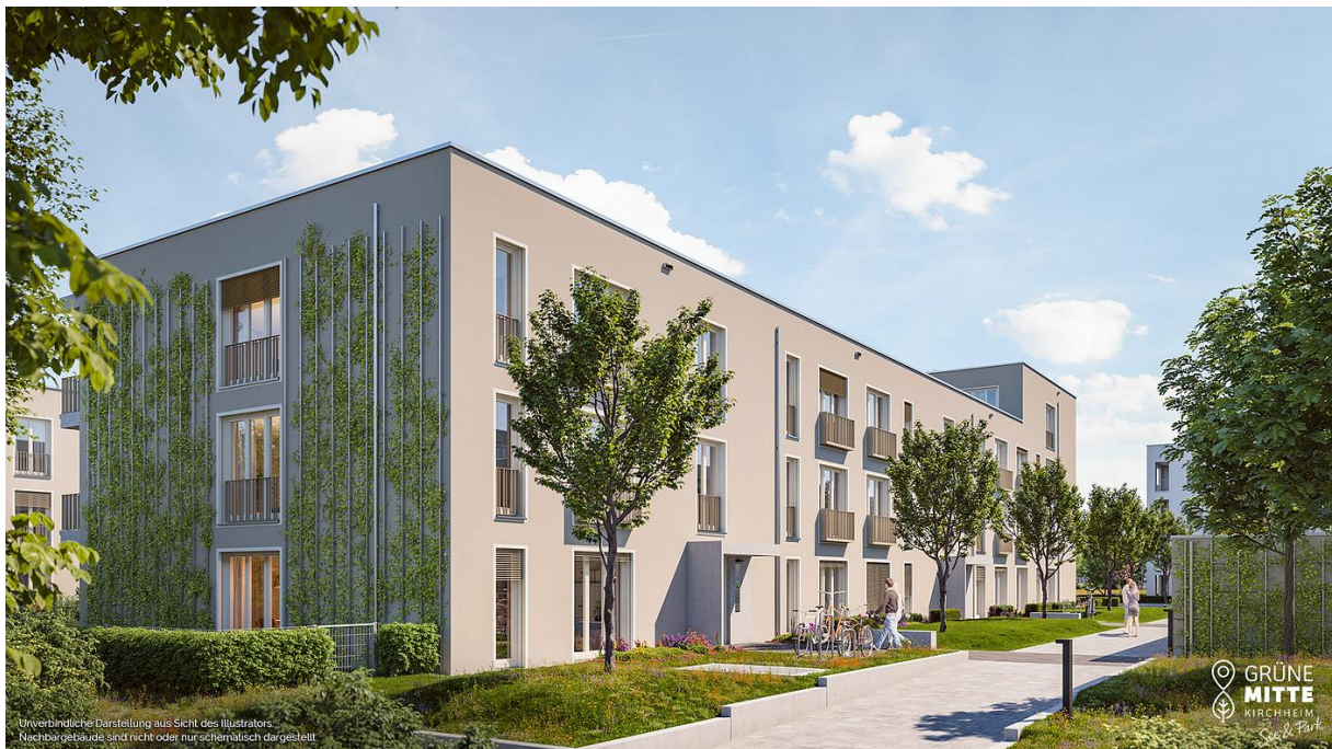
Unverbindliche Darstellung aus Sicht des Illustrators. Nachbargebäude sind nicht oder nur schematisch dargestellt.